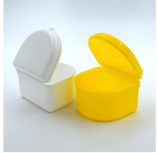
3525 - DIŞ PROTEZ KUTUSU