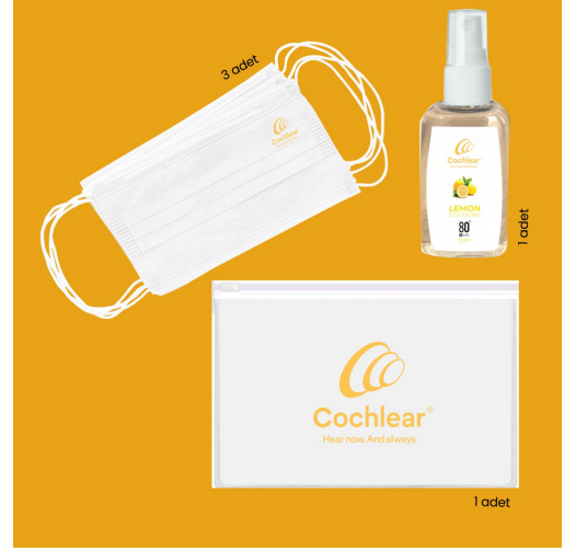
3593 - 3'LÜ HIJYEN SETİ