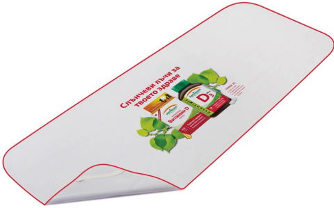
3522 - PVC MUAYENE MASA ÖRTÜSÜ