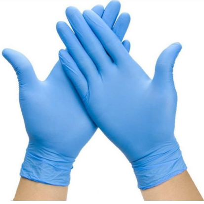
3510 - NITRİL ELDIVEN