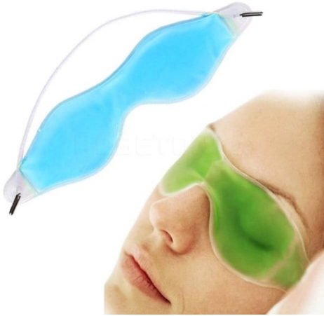
3508 - JEL GÖZ TERAPİ MASKESİ