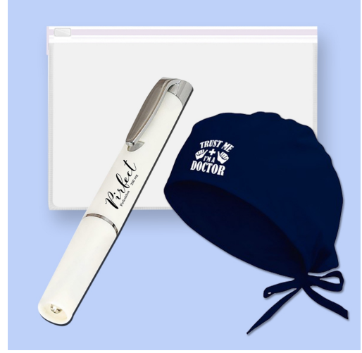
3598 - 3'LÜ DOKTOR SETİ