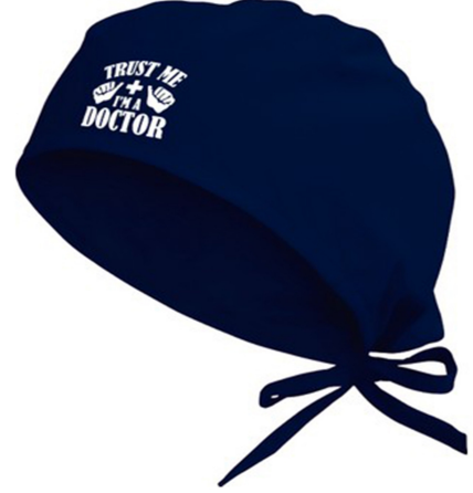
3500 - DOKTOR BONESI