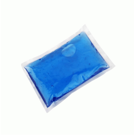
3505 - SOĞUTUCU JEL