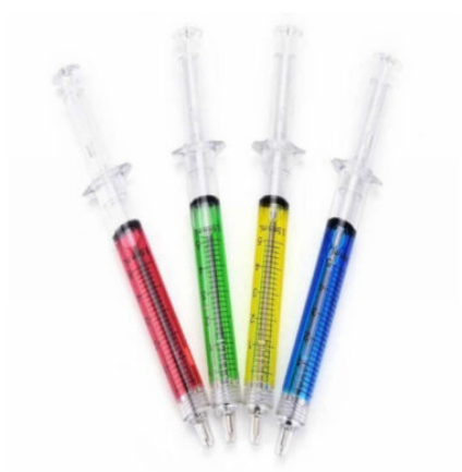
6045 - ŞIRINGA TÜKENMEZ KALEM