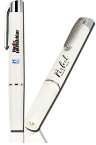
6022 - PENLIGHT