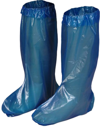
3501 - KULLAN AT ÇIZME