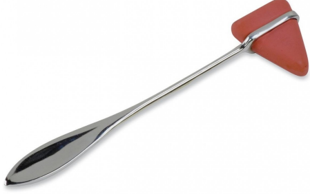
3524 - REFLEKS ÇEKİCİ