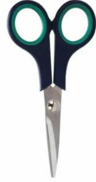
3216 - ECZANE MAKASI