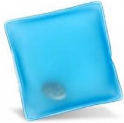
3506 - EL CEP SOBASI