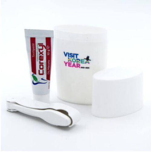
3512 - PROMOSYON DIŞ SETİ