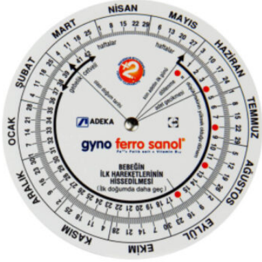
3527 - GEBELİK ÇARKI