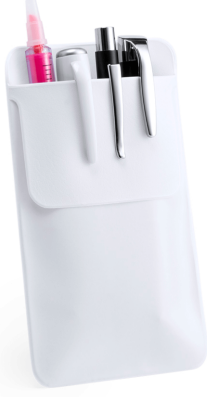
3502 - DOKTOR CEP KALEMLİĞİ