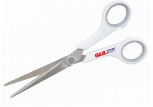
3215 - MAKAS