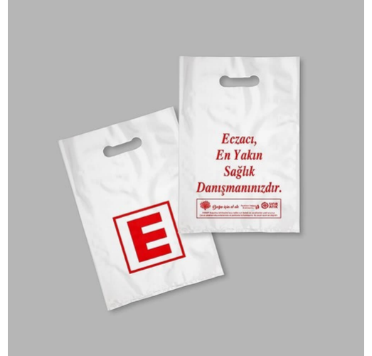
3504 - ECZANE POŞETİ 20X30 CM