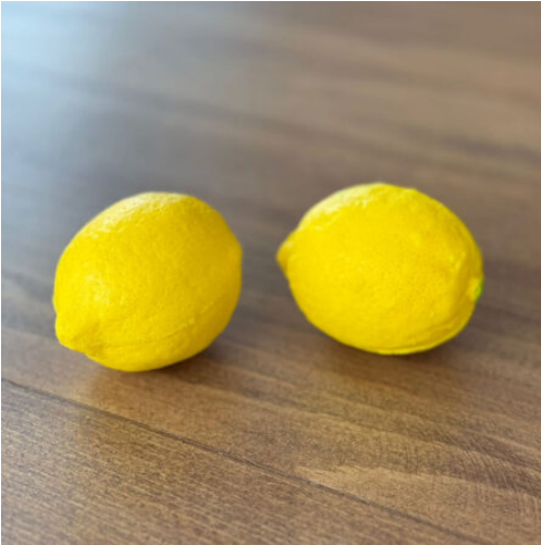
3521 - LIMON STRES TOPU