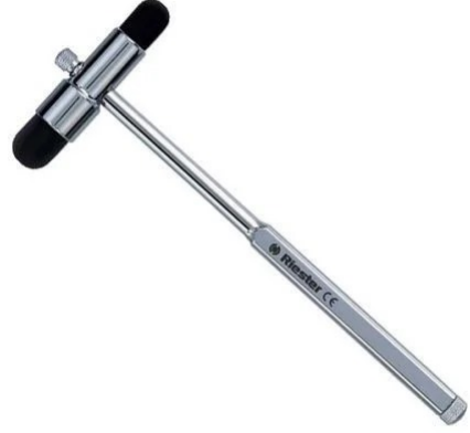
3523 - REFLEKS ÇEKİCİ