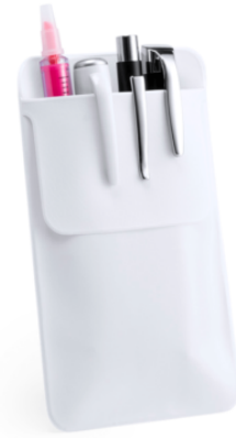
3502 - DOKTOR CEP KALEMLİĞİ