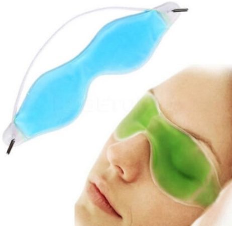
3508 - JEL GÖZ TERAPİ MASKESİ