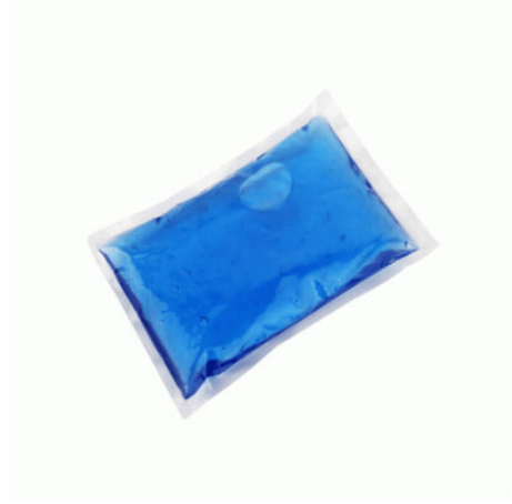
3505 - SOĞUTUCU JEL