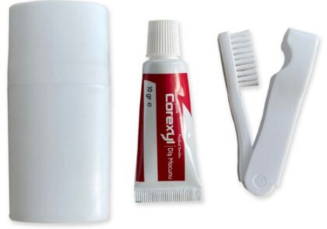
3512 - PROMOSYON DIŞ SETİ