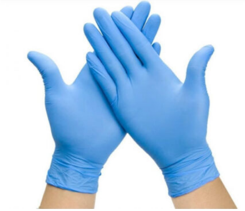
3510 - NITRİL ELDIVEN