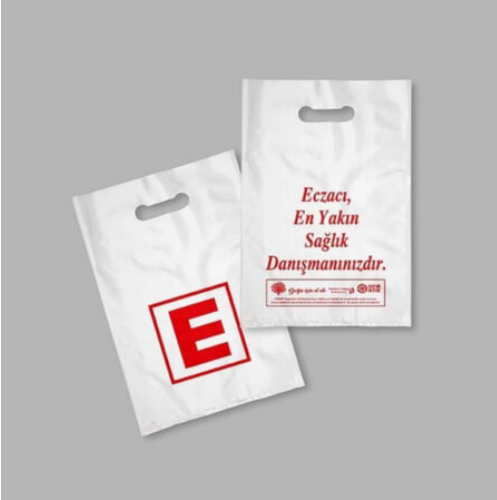
3504 - ECZANE POŞETİ