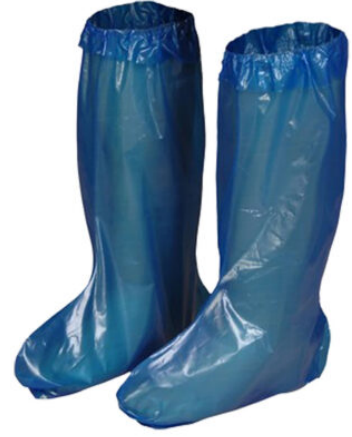
3501 - KULLAN AT ÇIZME