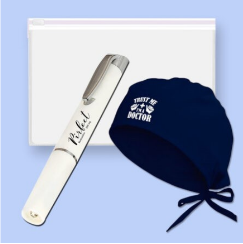
3598 - 3'LÜ DOKTOR SETİ