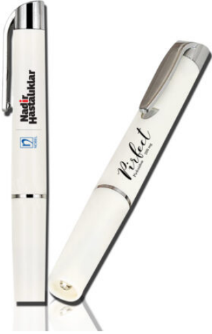
6022 - PENLIGHT