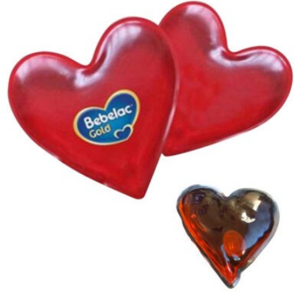
3503 - TERMOJEL KALP