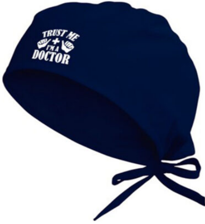
3500 - DOKTOR BONESİ