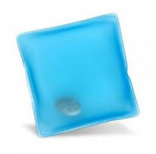
3506 - EL CEP SOBASI