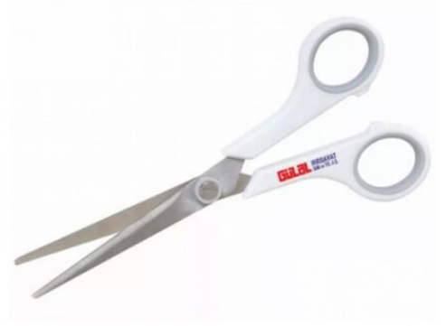
3215 - MAKAS