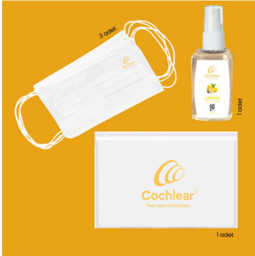
3593 - 3'LÜ HIJYEN SETİ