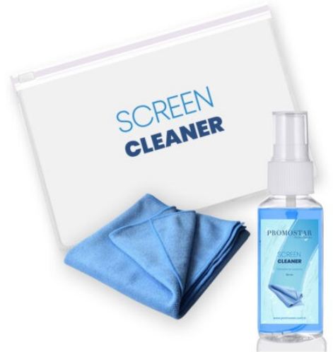
3599 - EKRAN TEMİZLEME KİTİ