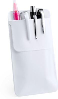
3502 - DOKTOR CEP KALEMLİĞİ