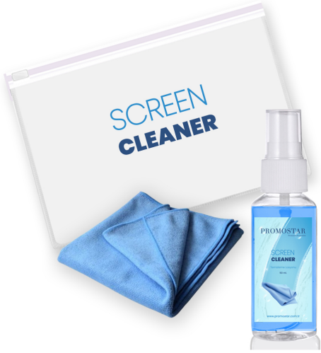
3599 - EKRAN TEMİZLEME KITI