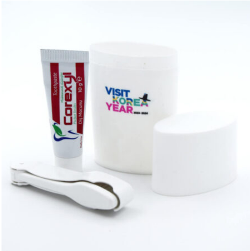
3512 - PROMOSYON DIŞ SETİ