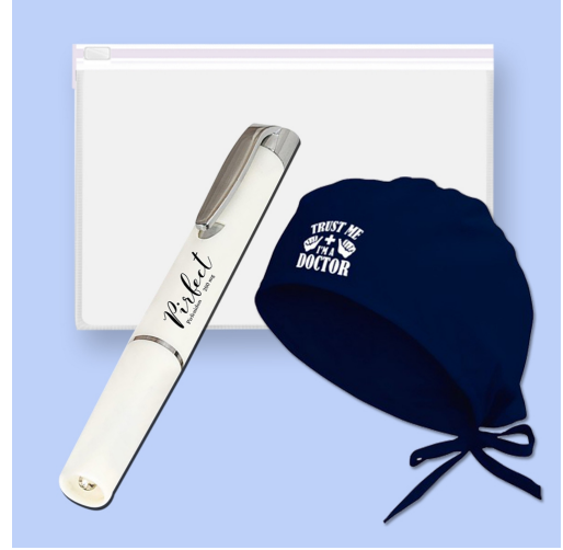
3598 - 3'LÜ DOKTOR SETİ