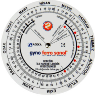
3527 - GEBELİK ÇARKI