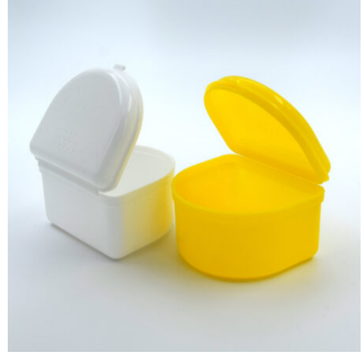
3525 - DIŞ PROTEZ KUTUSU